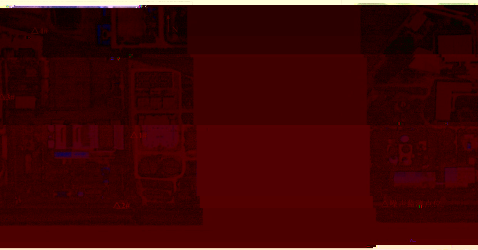
附图 1 监测点位示意图