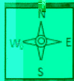
附图 1 采样点位示意图