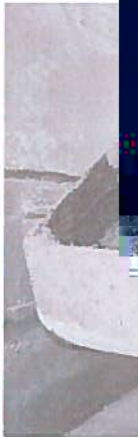
1#焚烧炉残渣 (■) 固体物